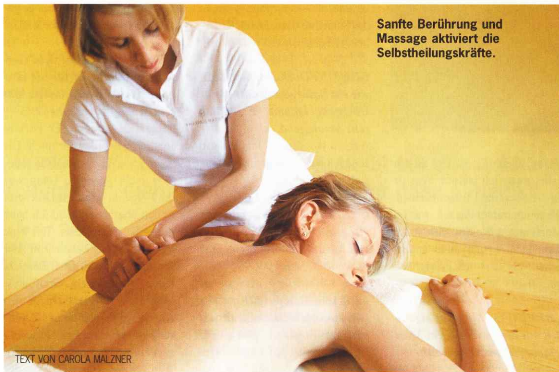
Sanfte Berührung und Massage aktiviert die Selbstheilungskräfte.

ENERGIE. Tief in seinem Inneren verfügt der Mensch über eine besondere Kraft- und Glücksquelle. Der Zugang dazu ist häufig verschüttet – eine ganzheitliche Massagemethode führt wieder hin.